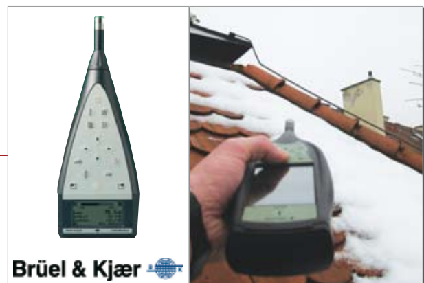
Alle Schallmesspartner arbeiten mit Schallpegelmessgeräten der höchsten Genauigkeitsklasse 1 von Brüel & Kjær.