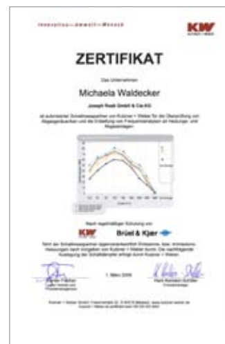
Nur ausgewählte und geschulte Partner erhalten das Kutzner + Weber-Zertifikat.

Schnelle Schallmessungen ganz in Ihrer Nähe. Mehr unter: www.kutzner-weber.de/service